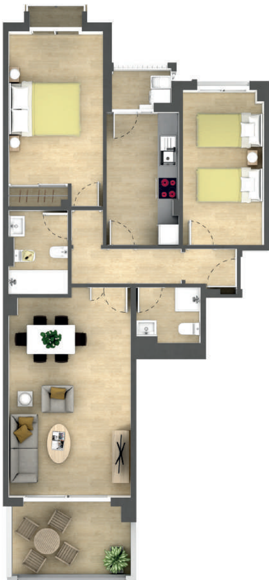
Vivienda Tipo X Dwelling Type X Апартаменты Типа X