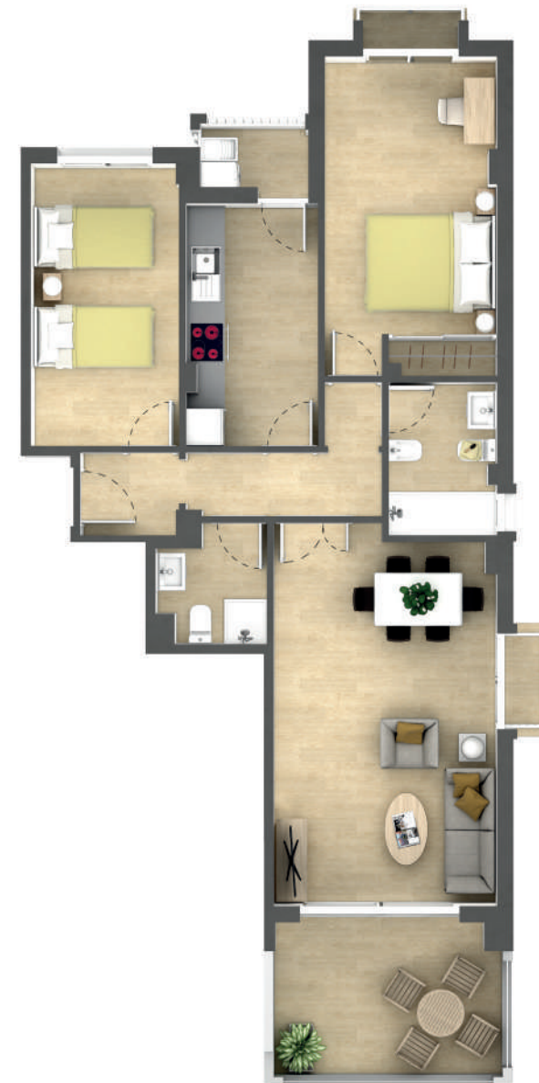
Vivienda Tipo Z Dwelling Type Z Апартаменты Типа Z