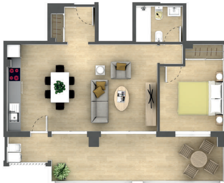
Vivienda Tipo Y Dwelling Type Y Апартаменты Типа Y