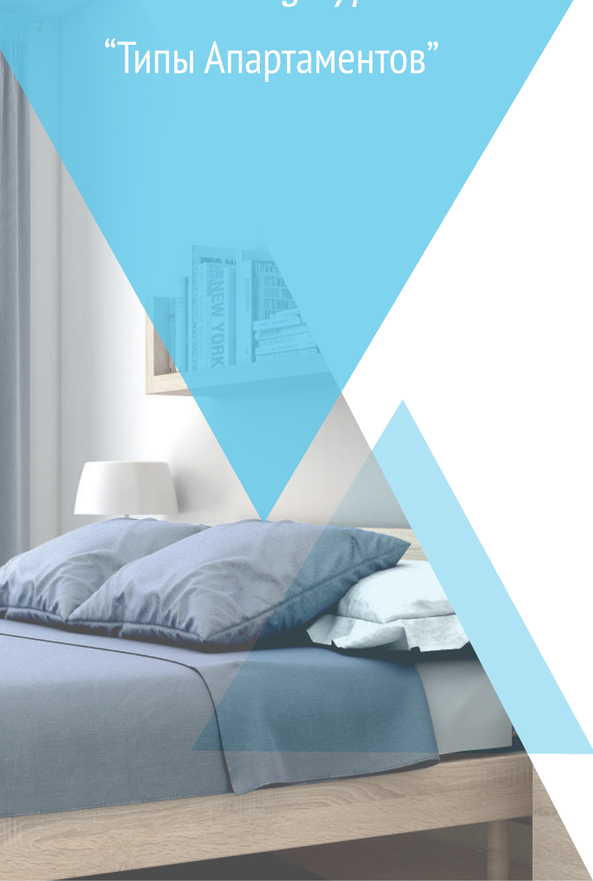
Vivienda Tipo V Dwelling Type V Апартаменты Типа V